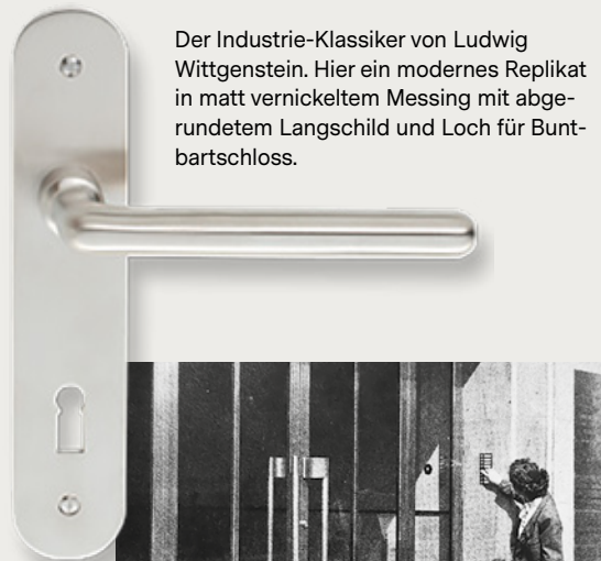
Der Industrie-Klassiker von Ludwig Wittgenstein. Hier ein modernes Replikat in matt vernickeltem Messing mit abgerundetem Langschild und Loch für Buntbartschloss.